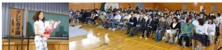
テレビ寺子屋 公開録画、開場